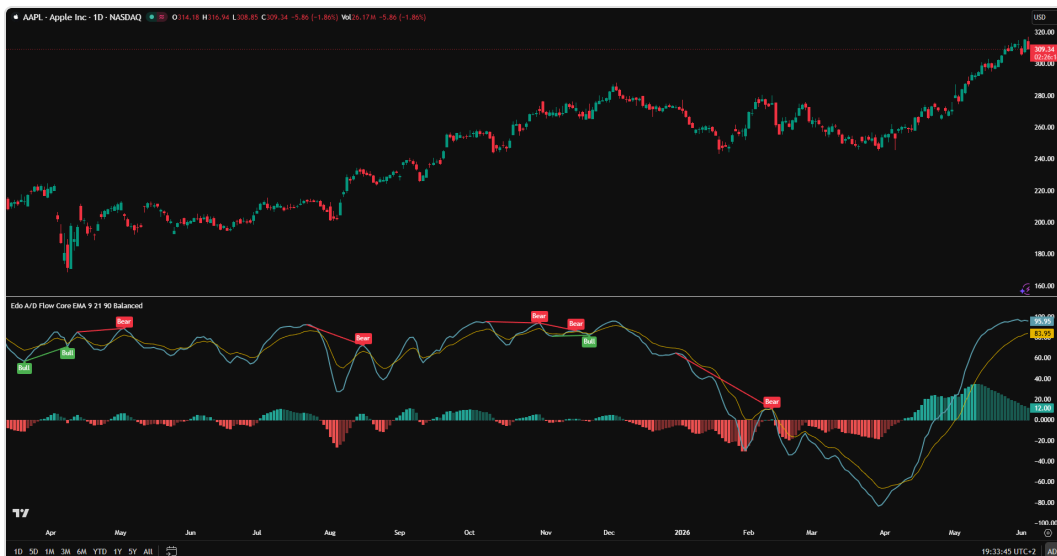
Histograma mostrando alternancias entre Bullish Strong, Bullish Weak, Bearish Strong y Bearish Weak en un mismo tramo de cotización.

Esta diferenciación permite anticipar cambios de régimen sin esperar el cruce explícito de las líneas. Cuando una serie de barras Bullish Strong da paso a barras Bullish Weak, el flujo alcista sigue intacto pero pierde inercia. Es el primer aviso de que un cruce a la baja podría aproximarse.