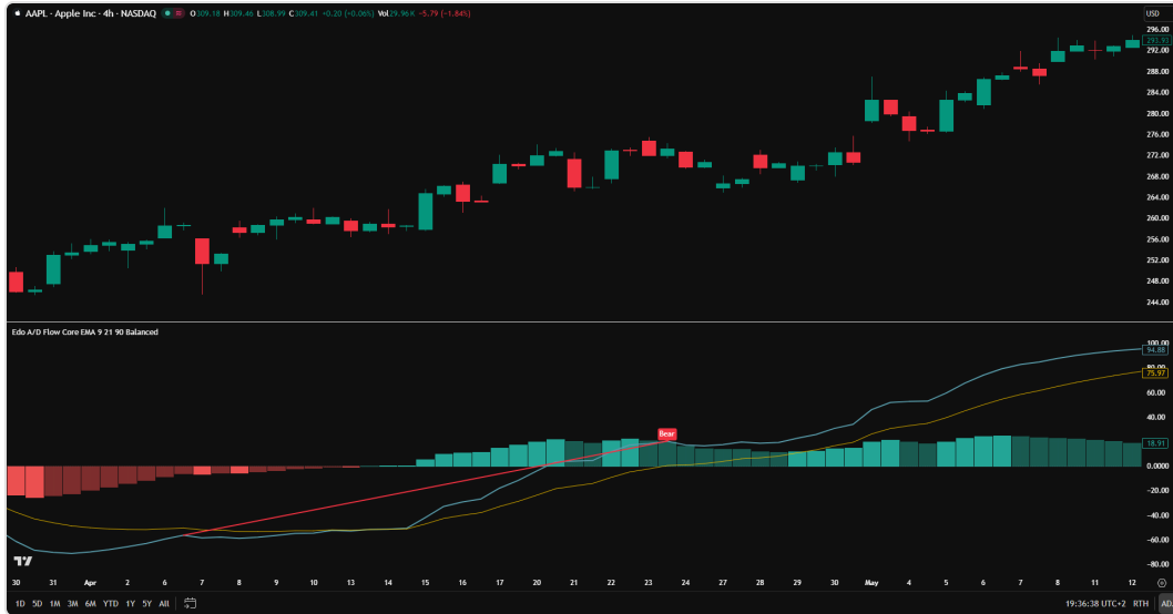
Close-up de la transición de Bearish Strong a Bullish Strong tras el cruce alcista de las líneas Fast y Slow.

La línea cero del histograma se dibuja punteada en gris para que el cruce de la zona neutra sea siempre visible.