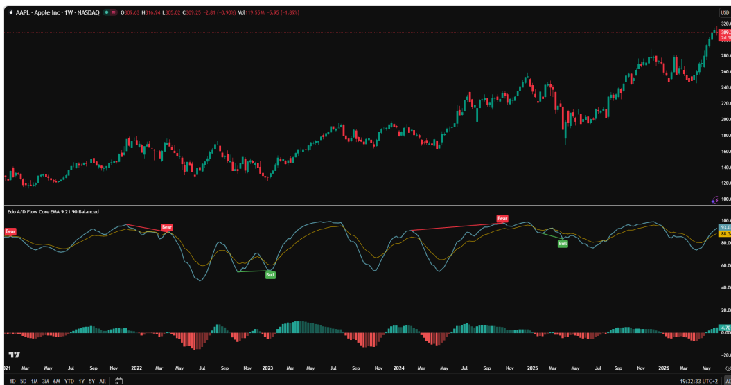
Edo A/D Flow Core sobre AAPL semanal: línea Fast (cyan), línea Slow (amarilla), histograma de cuatro estados y divergencias automáticas Bull / Bear.

Forma parte del ecosistema Edolab como indicador de uso libre y está pensado para traders que ya integran lectura de volumen y flujo en su análisis y buscan una versión coordinada y normalizada de la A/D Line, lista para combinar con cualquier sistema de momentum o estructura.