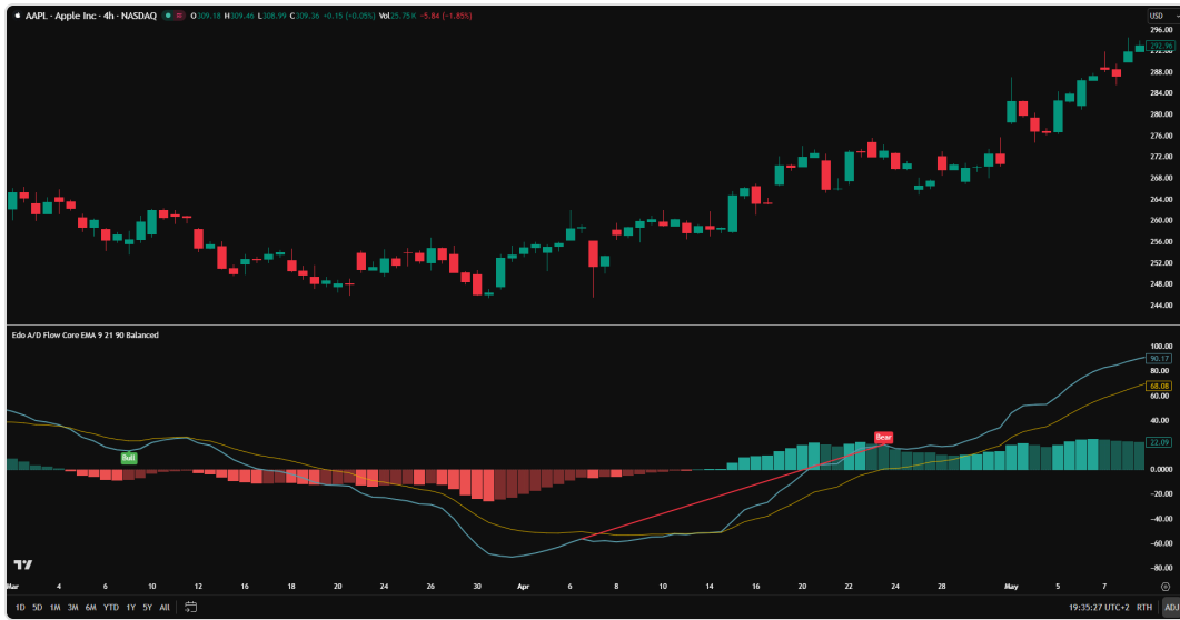
Vista 4H mostrando cómo el cruce Fast/Slow, la transición del histograma y la divergencia Bear se combinan para construir un sesgo bajista coherente.