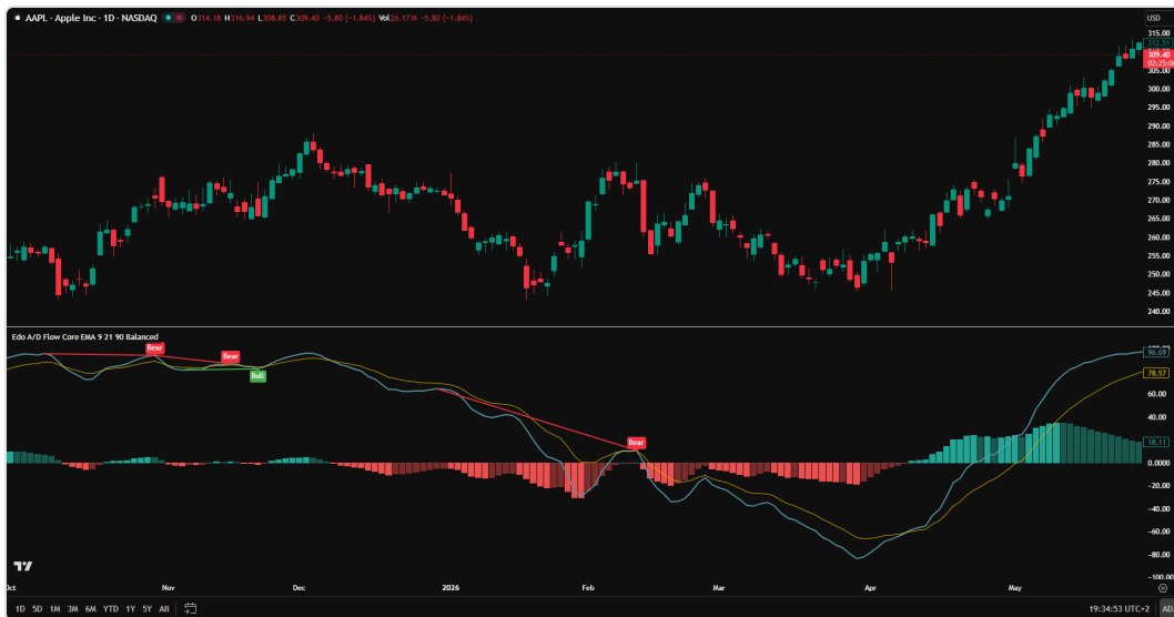
Cruce alcista de la línea Fast por encima de la Slow tras una fase prolongada de distribución. El histograma confirma con verdes crecientes.

Las líneas pueden ocultarse individualmente desde la sección "Display" de los inputs si el usuario prefiere trabajar únicamente con el histograma.